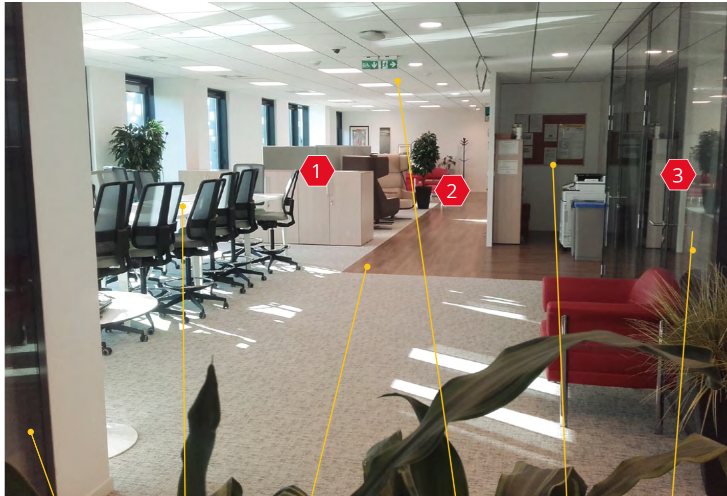
Deux bureaux individuels fermés Espace de travail « Open space » modulable en espace de réunion interne au service Différenciation des espaces (sols souples PVC/ moquette) Faux plafonds acoustiques (ossatures à joints creux) Espace Repto commun au service Isoloirs « bulle »