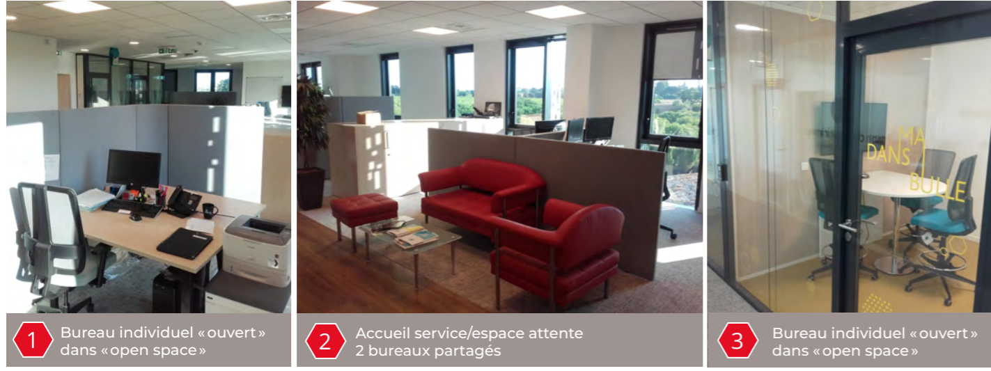
1 Bureau individuel « ouvert » dans « open space » 2 Accueil service/espace attente 2 bureaux partagés 3 Bureau individuel « ouvert » dans « open space »